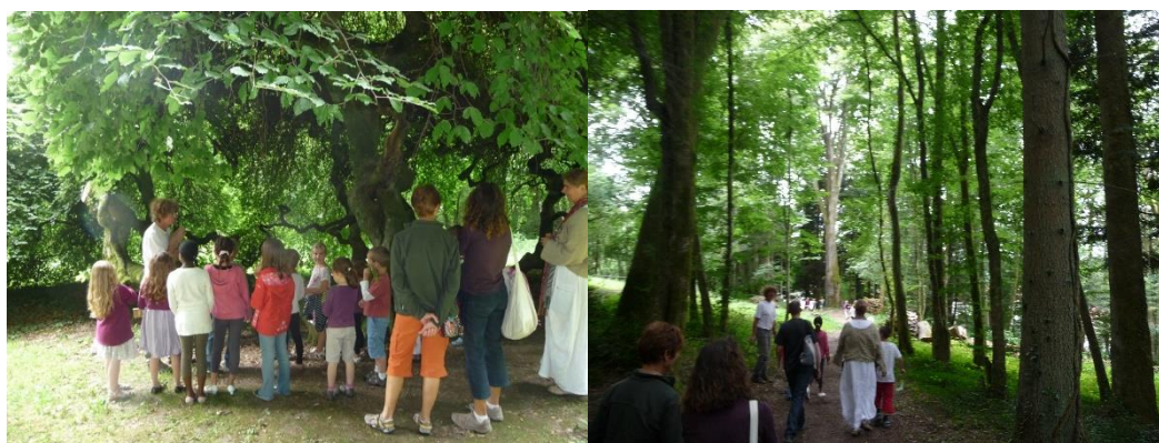
Actions de sensibilisation des enfants aux arbres du territoire