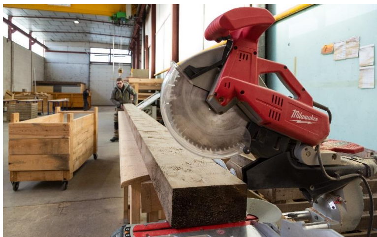
Exemple de machine-outil qui sera mise à disposition dans le Fab Lab