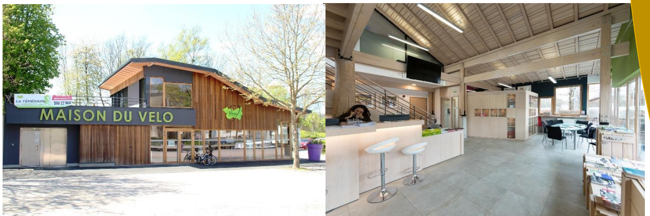
La Maison du Vélo d'Epinal, exemple d'utilisation du bois de hêtre dans la construction.